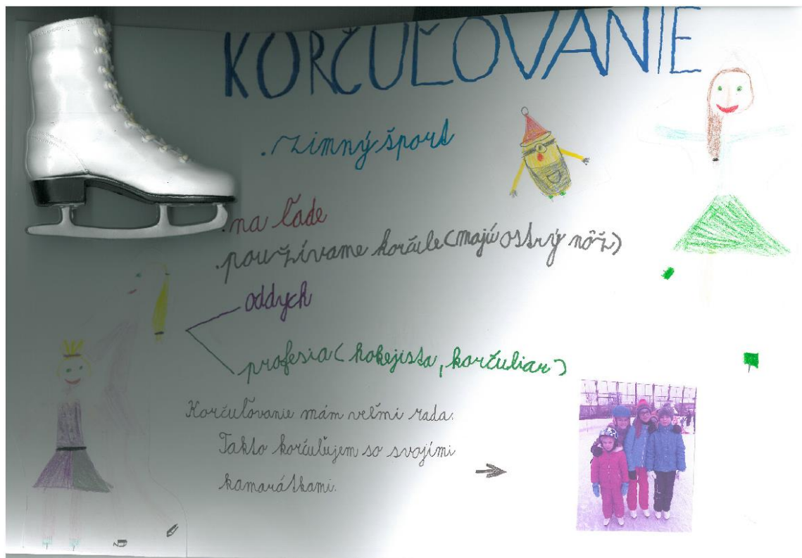
Petra Pongrácová, 2. Owls