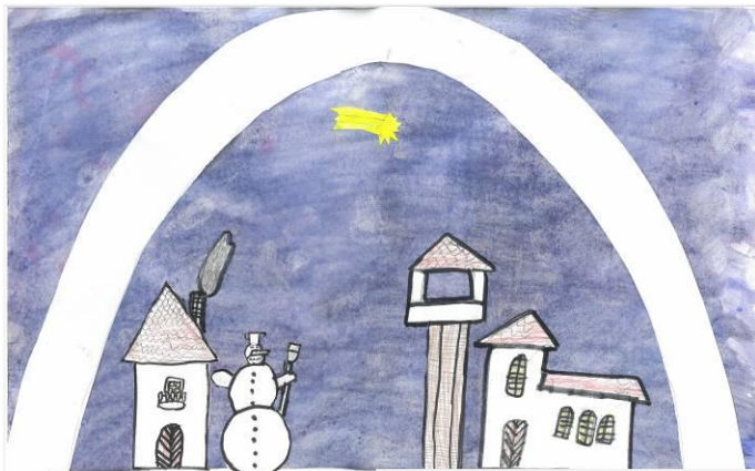
Lukáš Vršanský, 4. P