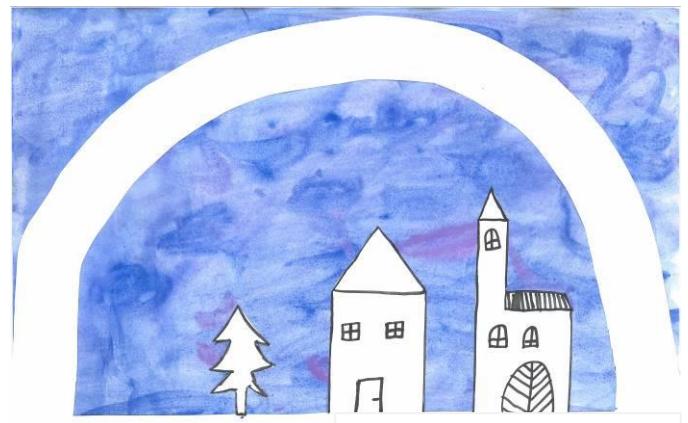
Žofia Bartová, 4. P