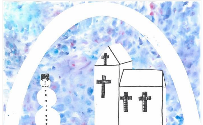
Zuzana Vedejová, 4. P