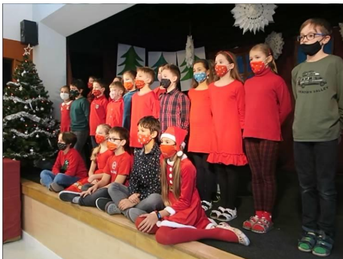
Nácvik vianočného videa, 4. W