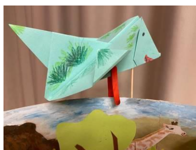
Krištof Grujbár, 3. W