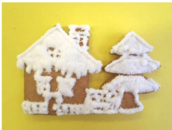
Autor: Lucia Simonidesová, 3. D