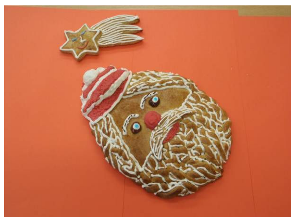
Autor: Nina Habániková, 2. G